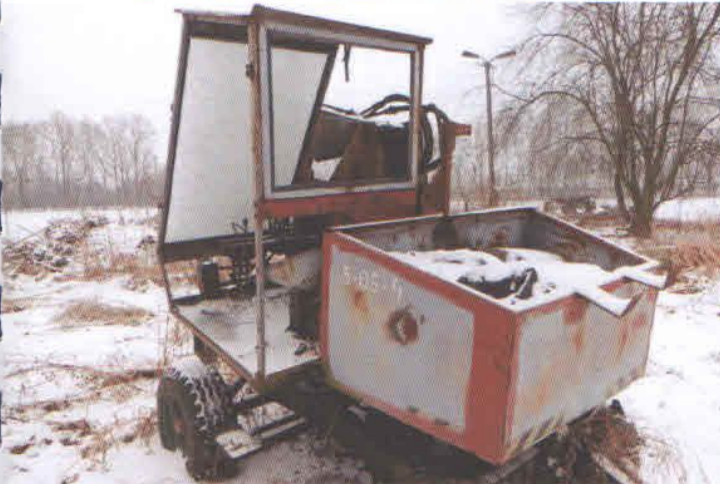
Lp. 8 - Ładowacz hydrauliczny typu Cyclop (4)