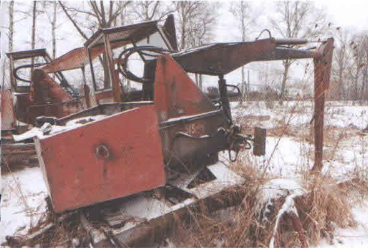
Lp. 8 - Ładowacz hydrauliczny typu Cyclop (2)