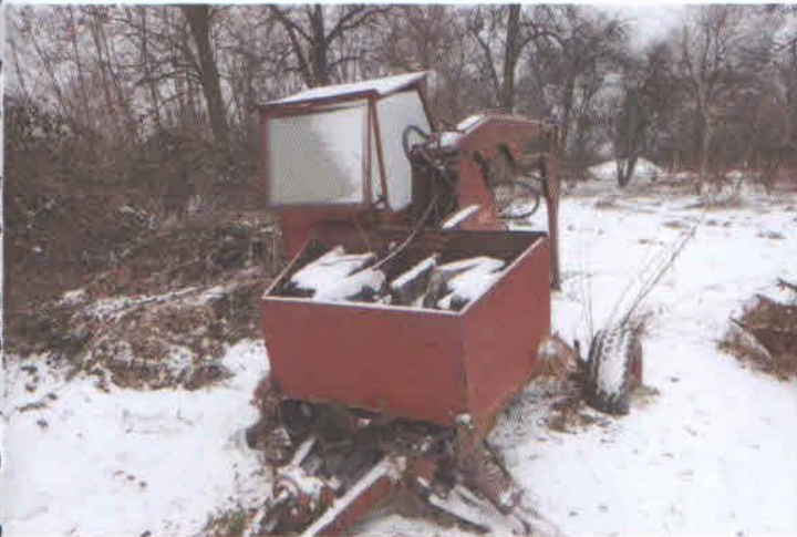
Lp. 7 - Ładowacz hydrauliczny typu Cyclop (7)