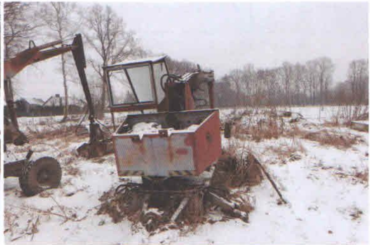
Lp. 8 - Ładowacz hydrauliczny typu Cyclop (1)