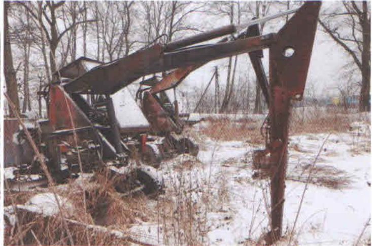
Lp. 8 - Ładowacz hydrauliczny typu Cyclop (3)