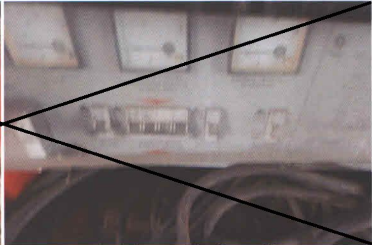
Lp. 9 - Agregat prądotwórczy (3)