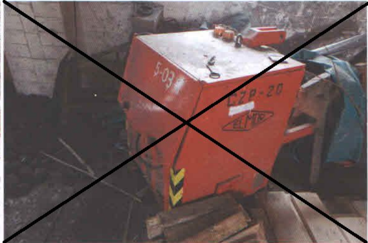
Lp. 9 - Agregat prądotwórczy (1)